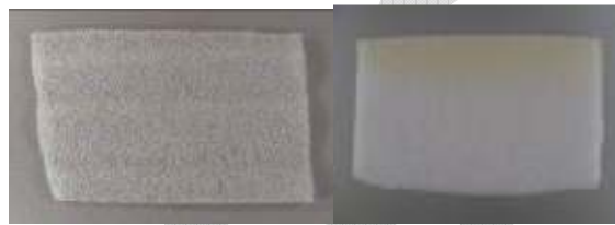
Mynd 7. Til vinstri: Polyethylene frauðplast, myndin sýnir Jiffy frauðplast. Hentar til skammtímarvarðveislu.

Polyurethane frauðplast er ekki sambærilegt. Niðurbrot þess er hratt og getur það fest sig við gripi og valdið alvarlegum skemmdum. Hægt er að þekkja það á áberandi gulnun og upplitun. Polyether frauðplast brotnar einnig niður á fáeinum árum.