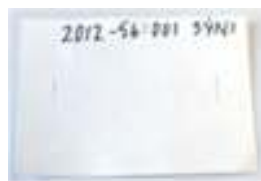
Mynd 3. 2012-56-001 Sýni.

Þetta þarf að merkja skýrt með orðinu Sýni á eftir fundarnúmerinu.