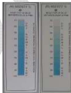
Mynd 6. Rakavísar; vinstra megin er þurr (lægri en 10% RH); hægra megin rakur (20%RH).