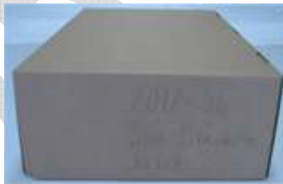
Mynd 5. Dæmi um merkingu kassa.