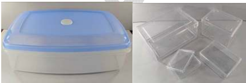
Mynd 8. Til vinstri: loftþéttir HDPE kassar; hentar til varðveislu gripa í örumhverfi.

Hægt er að kaupa loftþétta HDPE kassa í verslunum sem selja eldhúsvörur. Litlar polycarbonate öskjur er hægt að fá hjá Þjóðminjasafni Íslands.