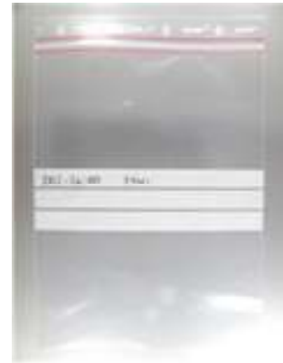
Mynd 4. Merking poka.