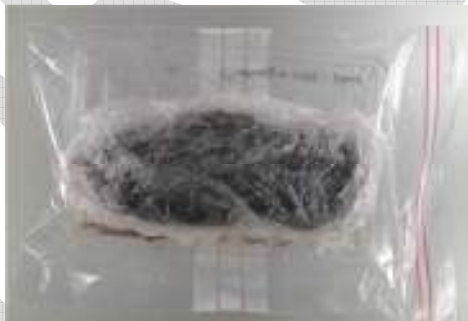
Mynd 2. Vatnsósa viður, pakkað í plastfilmu og tvöfaldan poka með stífum stuðningi.