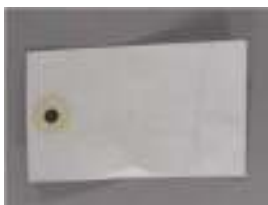
Mynd 10. Tyvek merkimiði.