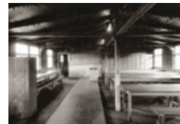
Fig. 43. Den restaurerede fløj »Bloch 38A« i Sachsenhausen. Barakken blev for få år siden ødelagt af nynazistiske brandstiftere.

„Kære fru Christensen! Jeg er meget glad for at kunne skrive dette brev til Dem. Jeg er sund og rask og takker for alle Deres kære breve, som altid har gjort mig meget glad. I dag vil jeg bede Dem om hurtigst muligt at sende mig uldne undertrøjer og bukser, hand-