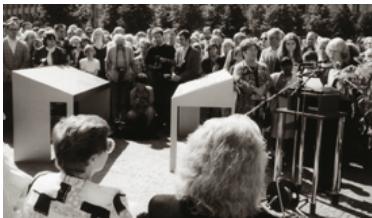
Fig. 38. Fra stenafsløring i Bielefeld den 16. august 1998. Stenene bærer navnene på alle kendte jødiske fanger i Bielefeld, i alt 1.841. Ruth og Schulims navne er indgraveret i en af de to sten som beboerne i Bielefeld går forbi hver gang de ankommer til eller forlader byens banegård. Foto venligst stillet til rådighed af Brigitte Decker, Bielefeld 65 .