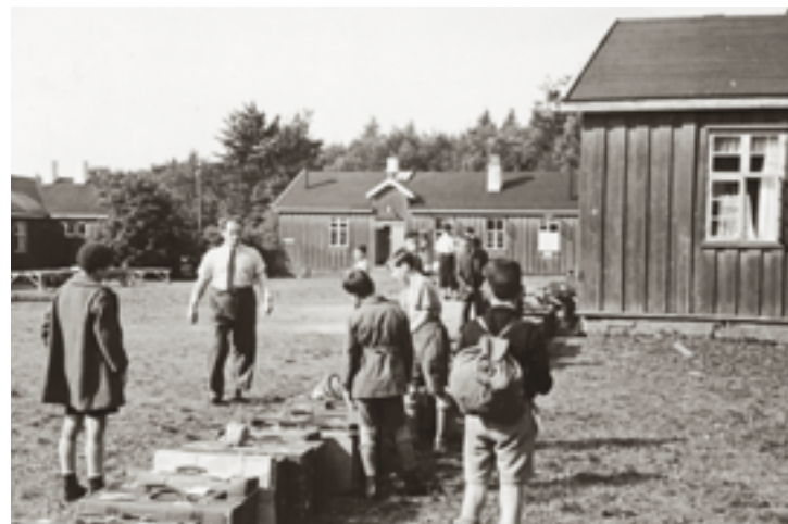
Fig. 45. Jødiske børn fra Berlin på Kinderlager i Horserød i sommeren 1935.

Den 7. oktober 1940 godkendte et medlem af Komiteen for Horserødlejren i Nordsjælland en Overenskomst mellem Komiteen og Justitsministeriet angaaende Ministeriets Benyttelse af en Del af Lejren . Men allerede i august 1940 var Justitsministeriet dog begyndt at anvende fire barakker i Horserød. Man fyldte snart barakkerne med flygtninge.